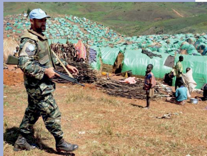
Friedensmissionen: Forschung zu Menschenrechtskomponenten bei Auslandseinsätzen Peace Missions: Research on human rights components of international missions

Als unveräußerliche Rechte müssen Menschenrechte auch in sicherheitspolitischen Krisenzeiten beachtet werden. Dies gilt insbesondere für die notstandsfesten Menschenrechte. Während im öffentlichen Diskurs vielfach das Konfliktpotential zwischen sicherheitspolitischen Erwägungen und menschenrechtlichen Normen betont wird, weist das Institut auf die Wahrung der Menschenrechte als Voraussetzung einer aufgeklärten Sicherheitspolitik im Innen- und Außenbereich hin. Auch für die internationale Konfliktbewältigung sind menschenrechtliche Komponenten, etwa ein menschenrechtliches Monitoring bei friedensbildenden und bei militärischen Einsätzen und die Integration einer Geschlechterperspektive als Prinzip der internationalen Konfliktbewältigung unverzichtbar.