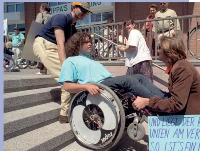
Diskriminierung: Protest von Rollstuhlfahrer/innen an einer S-Bahnstation in Frankfurt/Main

Discrimination: Protest of people with disabilities at a metro station in Frankfurt/Main