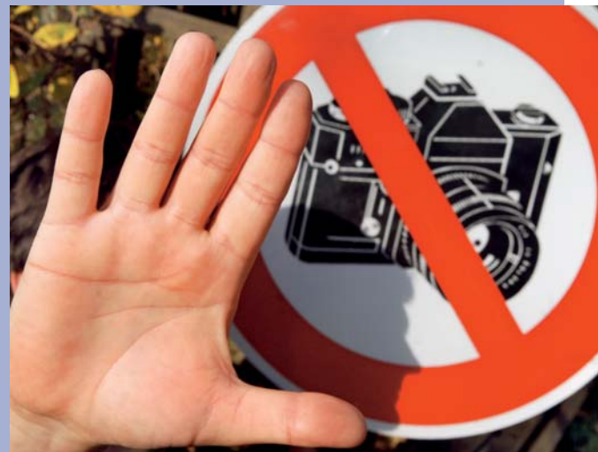
Pressefreiheit in Gefahr?: Podiumsdiskussion auf der Frankfurter Buchmesse 2005 Freedom of the Press at Risk: Panel Discussion at the Frankfurt Bookfair