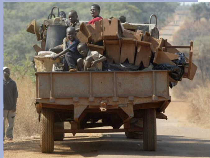
Zwangsvortreibung: Workshop mit dem UN-Sonderberichterstatter für das Recht auf angemessene Unterkunft in Berlin Forced expulsions: Workshop with the U.N. Special Rapporteur on adequate housing in Berlin