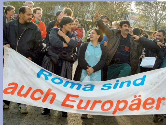
Antiziganismus: Ein Thema der Instituts-Vortragsreihe "Rassismus" Antiziganism: Subject of the lecture series on "Racism"

B ildungs- und Lernprozesse übernehmen eine zentrale Funktion bei der Förderung eines gesellschaftlichen Verständnisses der Menschenrechte und geben wichtige Impulse für ihre Umsetzung. Das Institut versteht Menschenrechtsbildung als eine seiner wesentlichen Aufgaben.