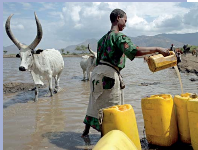
Recht auf Gesundheit: Stärkung des Menschenrechtsansatzes in der Entwicklungszusammenarbeit Right to health: A human rights approach in development cooperation

M enschenrechte stellen eine international vereinbarte Grundlage dar, die Entwicklungszielen einen rechtlichen und normativen Rahmen geben. Somit verfeinert der menschenrechtliche Blick auf Armut mit den Schwerpunkten Diskriminierungsschutz und Staatenpflichten das Instrumentarium der Entwicklungspolitik. Dazu stärken Menschenrechte partizipative Prozesse in der Entwicklungszusammenarbeit und ergänzen sie um die Rechtsdimension. Menschen, die an entwicklungspolitischen Programmen teilnehmen, werden auf diesem Hintergrund nicht mehr ausschließlich aus der Perspektive der Bedürfnisbefriedigung betrachtet, sondern als Rechtssubjekte, die einen Anspruch auf Freiheit, Gleichheit und Teilhabe erheben können. Vor diesem Hintergrund haben das Bundesministerium für wirtschaftliche Zusammenarbeit und Entwicklung (BMZ) und seine Durchführungsorganisationen beschlossen, das Institut für breitere Weiterbildungs-