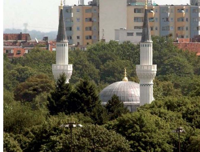
Menschenrechte und Islam: Großer Orientierungsbedarf Human Rights and Islam: a need for orientation