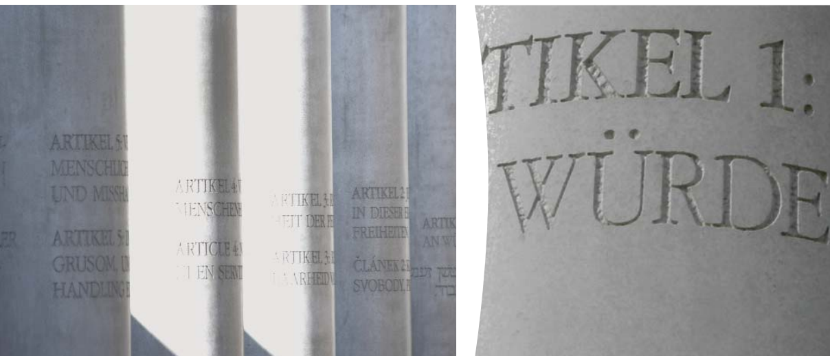
Menschenrechtsbildung: Respekt für die gleiche Würde aller Human rights education: respect for human dignity (Straße der Menschenrechte in Nürnberg, Stadt Nürnberg/Menschenrechtsbüro)

das Institut in Vorträgen und Diskussionsveranstaltungen menschenrechtliche Überlegungen in die entwicklungspolitische Diskussion ein.