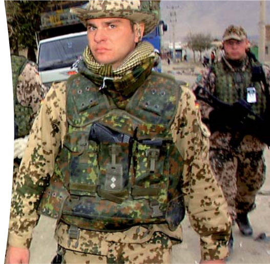
Menschenrechtsmonitoring: Auch bei Einsätzen der Bundeswehr im Ausland German armed forces deployed abroad: another field for human rights monitoring

und menschenrechtlichen Akteuren untersucht das Institut gegenwärtig die wichtigsten neueren sicherheitspolitischen und militärischen Entwicklungen auf verschiedenen Ebenen – von Deutschland über die Europäische Union bis hin zur NATO und zu UN- und US-Konzepten – mit dem Blick auf aktuelle und neue Kriege. Das Institut wirkt in dem EU-geförderten Projekt „Human Rights, Peace and Security in EU Foreign Policy“ mit, das sich zum Ziel gesetzt hat, ein Grundlagenpapier zu den menschenrechtlichen Dimensionen von Friedensoperationen für die Europäische Union zu entwickeln. Es handelt sich um ein Gemeinschaftsprojekt der akademischen Menschenrechtsinstitute in Europa. Besondere Aufmerksamkeit wird dabei Gender- und Menschenrechtskomponenten von Feldoperationen gewidmet. Ein Fachgespräch im Dezember 2004 befasste sich mit den Zusammenhängen zwischen Gender, Menschenrechten und Peacekeeping. In der UN-Resolution 1325 wird die Rolle von Frauen in Konflikten, Konfliktlösung und Peacekeeping beleuchtet und eine weit stärkere Berücksichtigung der Gender-Dimension im Friedensmissionen gefordert. Das Gespräch führte zu einer Reihe Empfehlungen zur Politikberatung, Forschung und Strategiebildung, die in die Weiterarbeit des Instituts einfließen.