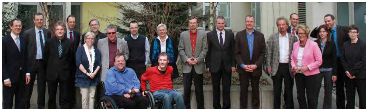
3. Treffen der Monitoring-Stelle mit den Behindertenbeauftragten aus Bund und Ländern im April 2013 in Berlin.

Die Monitoring-Stelle begleitet die Umsetzung der UN-Behindertenrechtskonvention in Deutschland. Sie gibt Stellungnahmen in Gerichts- und Gesetzgebungsverfahren ab, berät staatliche Stellen, leistet angewandte Forschung und organisiert Veranstaltungen zu Themen der Konvention.