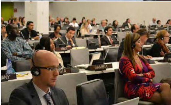
Treffen der UN-Arbeitsgruppe zu den Rechten älterer Menschen in New York 2012.