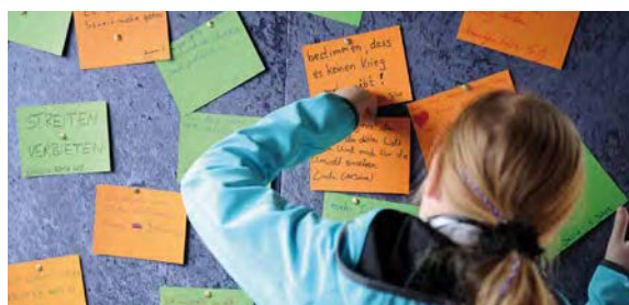
Rechte und Mitbestimmung von Kindern stärken. Mädchen beim Weltkindertag in Köln.

Viele Defizite bei der Umsetzung der Kinderrechte bleiben bestehen. Die Verhängung von Abschiebungshaft gegen 16- und 17-jährige unbegleitete minderjährige Flüchtlinge ist nur ein Beispiel. Eine umfassende und systematische Überprüfung der Vereinbarkeit des deutschen Rechts mit der KRK ist deswegen dringend nötig. So hat der UN-Kinder-