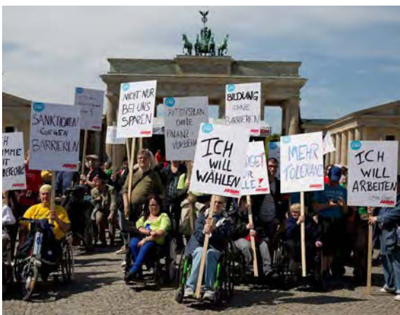
Menschen mit Behinderungen demonstrieren im Mai 2013 für barrierefreies Wählen und mehr politische Teilhabe.

Menschen mit Behinderungen sollen wählen und sich zur Wahl stellen können wie jede Bürgerin und jeder Bürger auch. Diese zentrale Anforderung der UN-Behindertenrechtskonvention – so selbstverständlich sie scheint und so einmütig sie über alle politischen Lager hinweg bekräftigt wird – ist hierzulande immer noch nicht vollständig umgesetzt. Noch immer sind nicht alle Wahlunterlagen, Wahllokale und Wahlveranstaltungen barrierefrei, und noch immer sind nicht alle wichtigen Informationen für eine informierte Wahl allen Menschen mit Behinderungen zugänglich. Außerdem sind weiterhin manche Menschen mit Behinderungen vom Wahlrecht ganz ausgeschlossen, ohne dass es hierfür eine sachliche Rechtfertigung gibt.