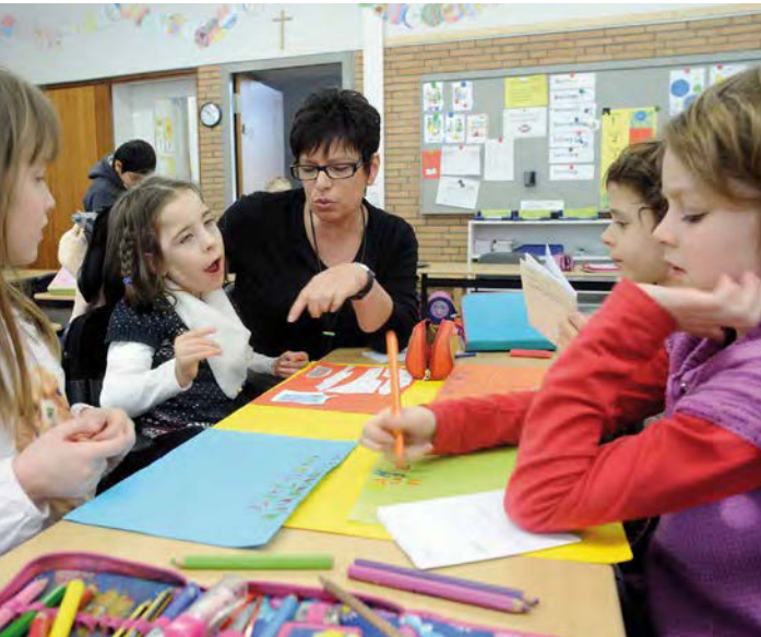
Inklusives Lernen, wie von der UN-BRK gefordert, hier an einer Grundschule in Neuss.

gehören Ansprüche auf Krankenbehandlung ebenso wie etwa solche auf medizinische oder berufliche Rehabilitation. Das Recht behinderter Menschen auf angemessenen Unterhalt hat in der UN-BRK große Bedeutung. Die Frage ist nun: Was folgt daraus für die Grundsicherung im Alter und bei Erwerbsminderung?