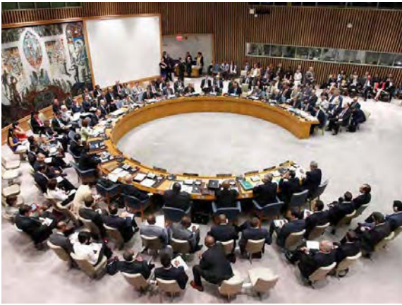
Der UN-Sicherheitsrat berät über die humanitäre Situation in Syrien, August 2012.

Bevölkerung zu schützen. Ist er hierzu nicht fähig, sollte er andere Staaten um Hilfe bitten. Wenn es zu beidem nicht kommt, sollte der Sicherheitsrat aus menschenrechtlichen Erwägungen ein Eingreifen diskutieren, einschließlich eventueller militärischer Mittel. Die Schutzverantwortung ist allerdings bei einer Reihe von Ländern des Südens umstritten. Der Sicherheitsrat hat sich auf sie bisher nur in wenigen Resolutionen ausdrücklich bezogen, etwa zu Libyen.