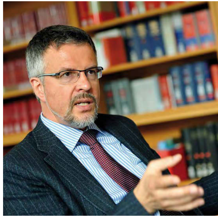
Peter Masuch ist seit 2008 Präsident des Bundessozialgerichtes und im Bundesvorstand der Bundesvereinigung Lebenshilfe.

Masuch: Inzwischen beziehen sich die Gerichte in zahlreichen Fällen auf die UN-BRK. Ich nenne zwei aktuelle Beispiele: Artikel 16 Absatz 4 der UN-BRK