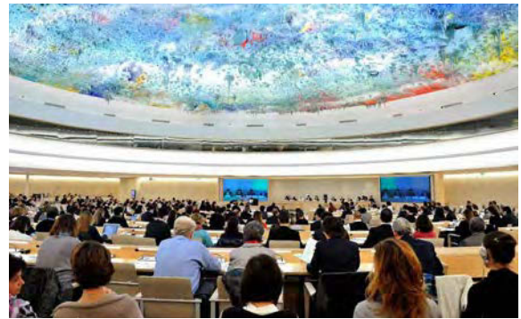
Sitzung des UN-Menschenrechtsrats in Genf zur Überprüfung der Menschenrechtslage in Deutschland.

Ein anderer Problembereich ist die Aufklärung von Vorwürfen von Polizeigewalt. Die Bundesregierung hat die Empfehlung, unabhängige Beschwerdestellen für den Umgang mit Polizeigewalt einzurichten, abgelehnt. Seit 2009 haben andere UN-Gremien, das Institut und zivilgesellschaftliche Organisationen darauf hingewiesen, dass hier Handlungsbedarf besteht. Nur eine geringe Zahl von Anzeigen führt zu Ermittlungsverfahren, und in noch weniger Fällen kommt es tatsächlich zu Verurteilungen. Das kann man nicht damit abtun, dass es sich bei den Anzeigen überwiegend um Falschbeschuldigungen handele. Die Gründe sind vielmehr vielschichtig: So führt beispielsweise ein falsch verstandener Corps-Geist dazu, dass sehr selten Polizeibeamte gegen ihre Kollegen aussagen. Zudem lässt sich der konkret beschuldigte Polizeibeamte oftmals nicht identifizieren. Hier würde eine Kennzeichnungspflicht, wie sie in einigen Bundesländern neuerdings existiert, helfen.