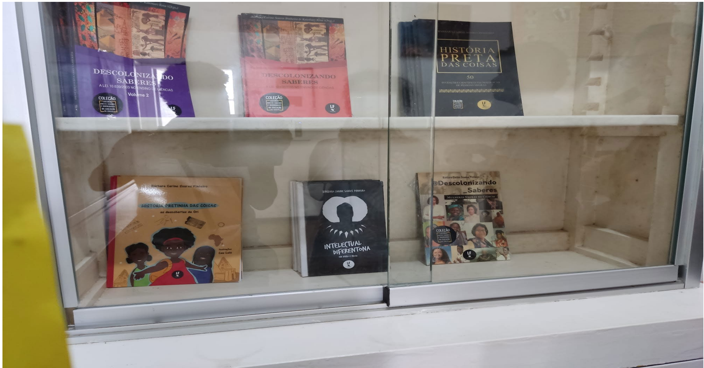
Bücher in der Vitrine auf der Folie 5 aufgelistet.