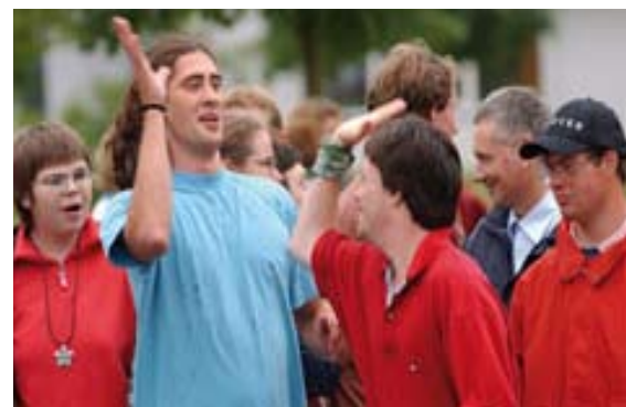
Das Ziel der Aktionspläne: ein gleichberechtigtes Zusammenleben von Menschen mit und ohne Behinderungen

Die UN-Behindertenrechtskonvention (kurz: Konvention oder BRK), die im März 2009 in Deutschland in Kraft getreten ist, verpflichtet den Staat dazu, bereits kurz nach ihrer Ratifikation geeignete, wirksame und zielgerichtete Maßnahmen zu ergreifen, um die